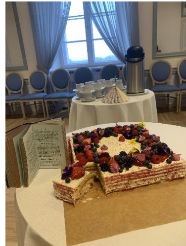
Pavārgrāmatu izstāde «Pavārgrāmatas. Laikmeta garšas»