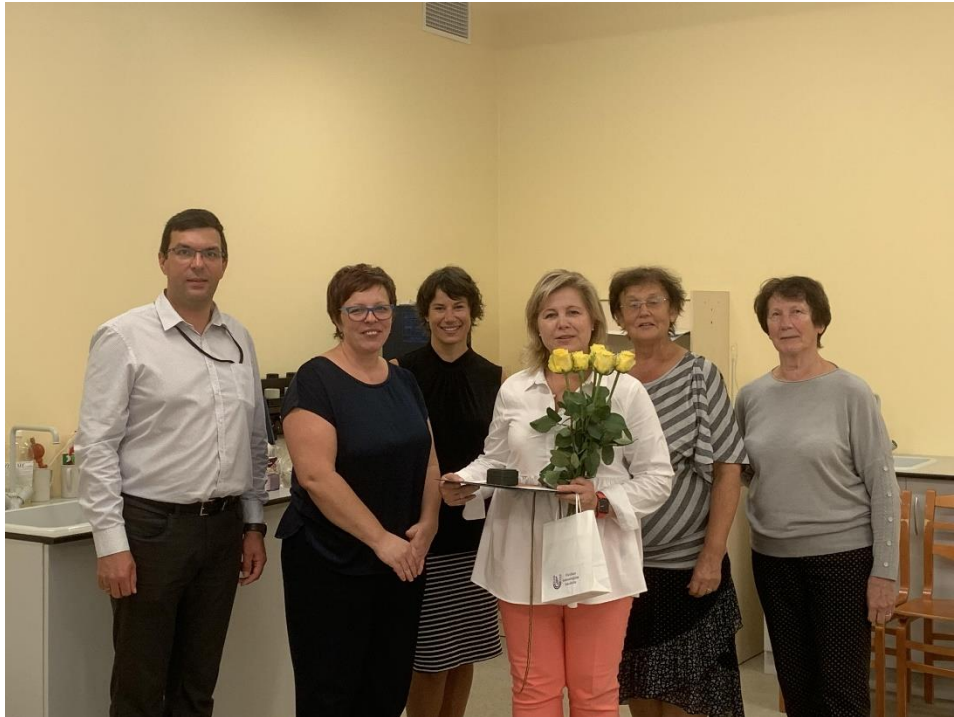
Uztura katedras kolektīvs