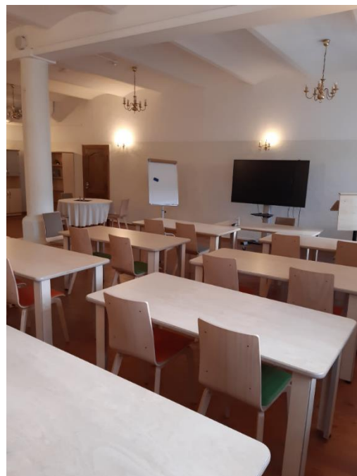
Mācību virtuve 2020. gadā

2020. gadā notiek pirmā Viesmīlības vasaras skola, kur dalībnieki iepazīst ēdināšanas un viesu izmitināšanas pakalpojuma būtību, iegūst zināšanas viesmīlības etiķetes, viesu