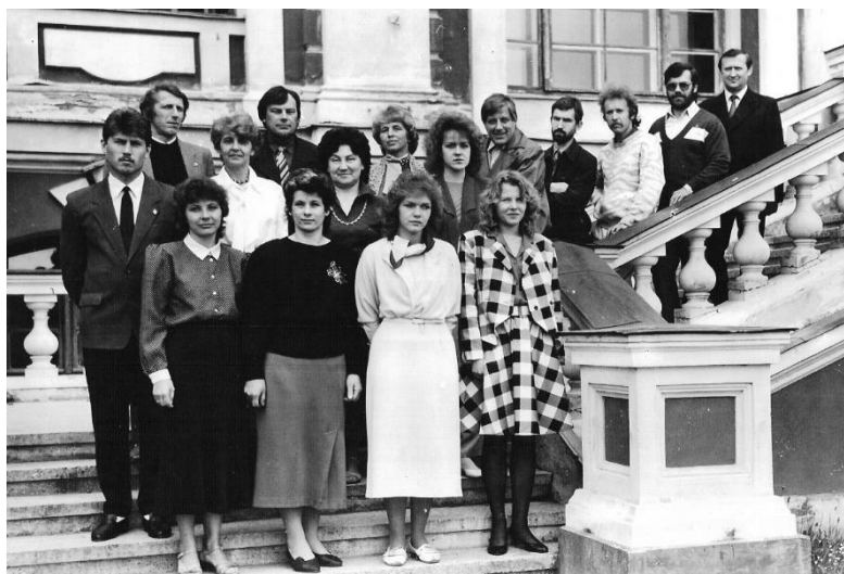
Uztura un darbmācības katedras kolektīvs 1989.gadā.