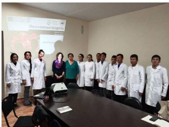
Meistarklases dalībnieki Kirgistānas Nacionālajā Agrārajā universitātē