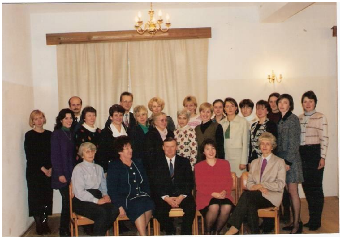
Uztura katedras kolektīvs